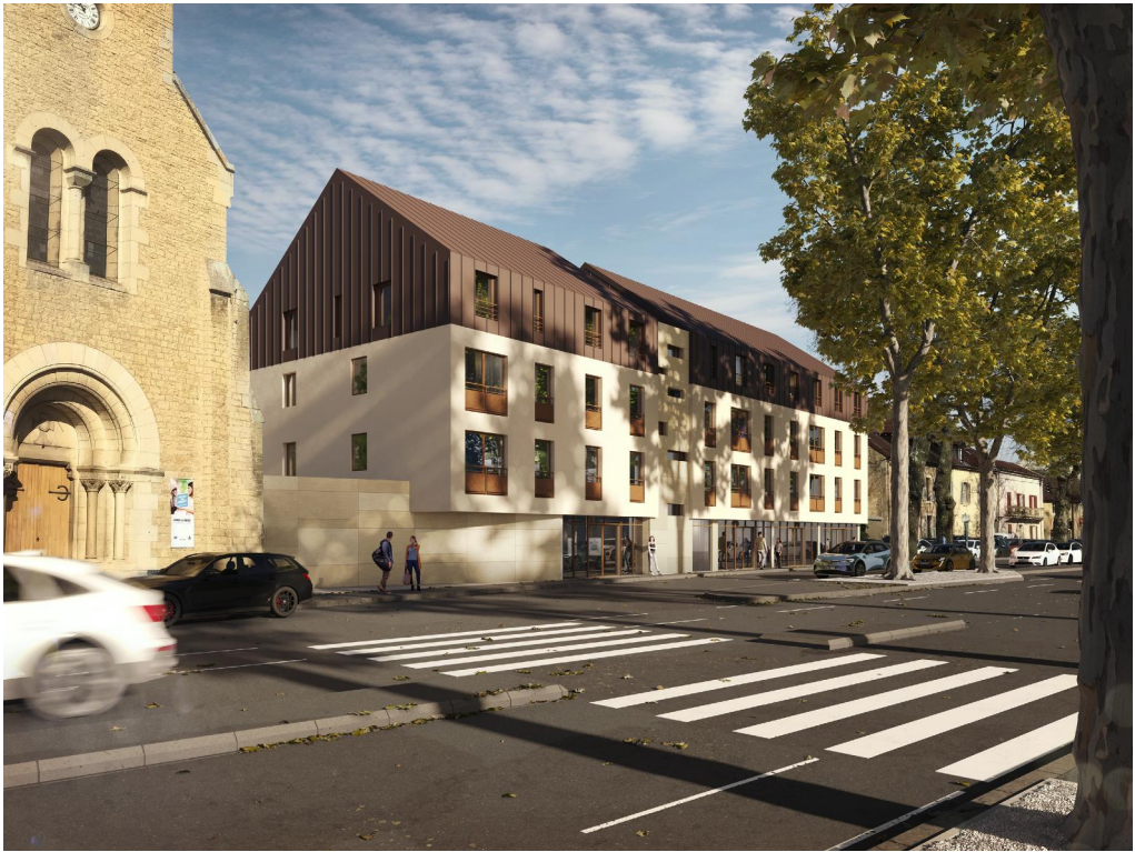
Perspective vers avenue Maréchal Juin

Nota : Les surfaces et cotes figurant au plan sont données à titre indicatif. Le présent document est établi sur la base du dossier d'exécution et pourra subir des adaptations dimensionnelles, techniques et d'organisation afin de répondre aux contraintes induites par les études détaillées d'exécution. Les poutres, poteaux, soffites et faux-plafonds n'apparaissent donc pas systématiquement. Les éléments de mobilier, meubles et plans de travaux, ne sont placés qu'à titre indicatif.